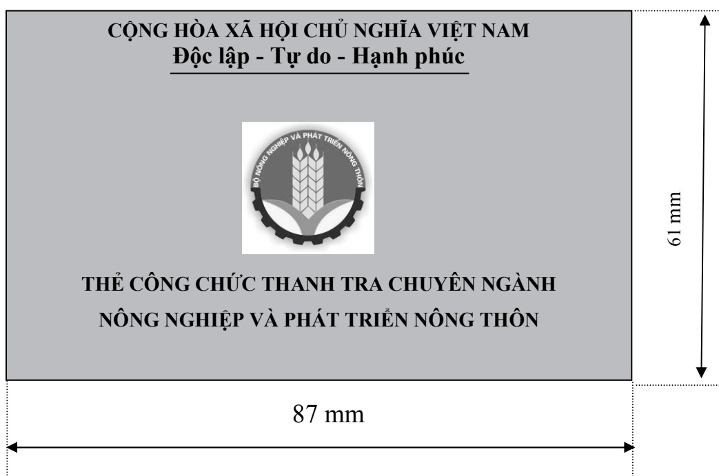
Hình 2: Mặt sau thẻ công chức thanh tra chuyên ngành